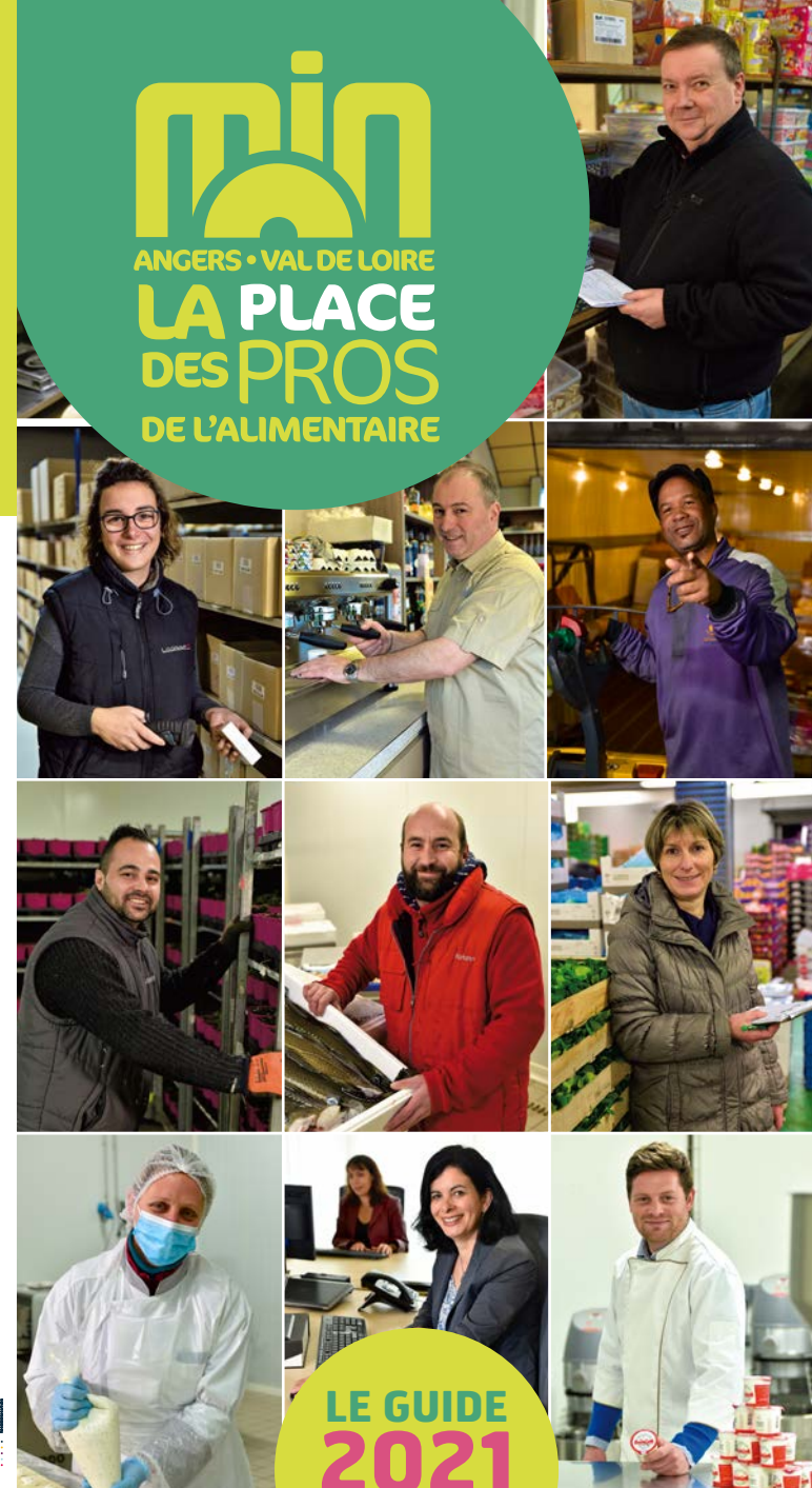
www.min-angers-49.fr Déciembre 2020

min ANGERS • VAL DE LOIRE LA PLACE DES PROS DE L'ALIMENTAIRE